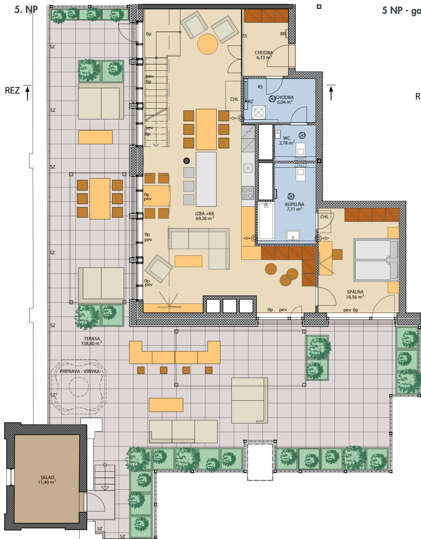
5 NP - galéria